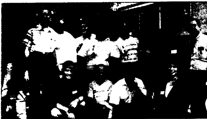
Asociación de inquilinos/Kansas City, en Kansas City, Missouri, con varios miembros del personal de la autoridad de vivienda.

Reglamento de Participación del Inquilino del HUD 24 C.F.R. 964