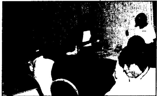
Retiro con residentes y personal de la autoridad de vivienda de Indianapolis.

Reglamento Interino del HUD 24 C.F.R. 903.13